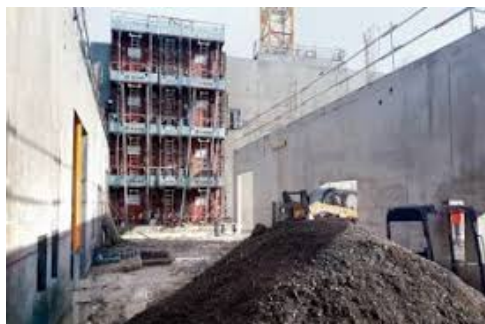
Pièce jointe : Images 2.jpeg